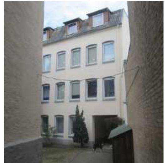
Blick in den Hof der Neustadt 34

Ratsfraktion DIE LINKE. F L E N S B U R G